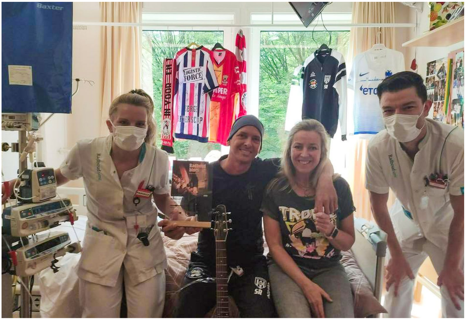
Figuur 1. Work-up tred 2019 - 2022