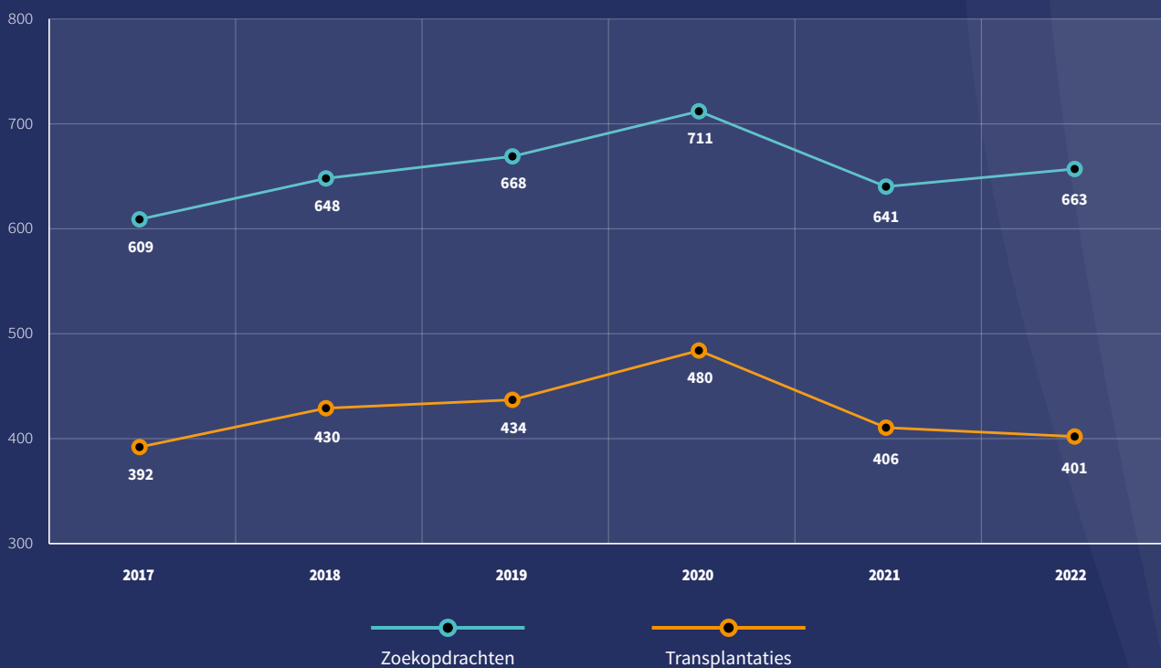
Figuur 1. Totaal aantal zoekopdrachten en transplantaties voor Nederlandse patiënten